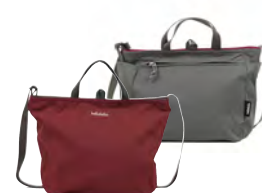
Berry Wine/Glacier Gray ベリーワイン / グレイシャーグレー