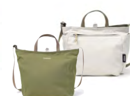
Bright Olive/Linen ブライトオリブ / リネン