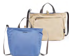
Classic Blue/Clay Khaki クラシックブルー / クレイカーキ