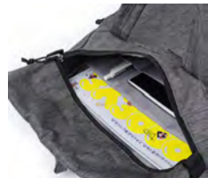
ゆとりのあるメイン収納は豊富なポケット付きで機能的

リサイクル素材を使用した軽量で環境に優しいアイテムです。トートバッグとしてもリュックとしても使えるスクエア型の 2way バッグです。容量は 20L で、通勤や通学、アウトドアなど、幅広くお使いいただけます。