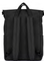
しっかりとしたハンドル付きなので持ちちも楽です

トートバッグとしてもリュックとしても使えるスクエア型の2wayバッグです。ゆったりとしたメイン収納は出し入れしやすく機能的。容量は20Lで、通勤や通学、アウトドアだけでなく、ショートトリップにもおすすめです。