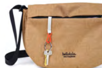
前面：ファスナーポケット (キークリップ付き)