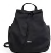
Ultra Black ウルトラ ブラック 4895147 723907 60-0000-25 REF: 50329-299