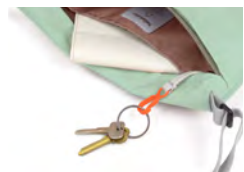
メイン収納：スリップ ポケットとキークリップ付

小ぶりのサイズ感で毎日使いたくなるミニショルダーバッグです。台形のフォルムは可愛らしさだけでなく収納力も抜群。旅行やレジャー、アウトドアや野外フェスなどにも気軽に持ち出せるコンパクトさが使いやすく、シンプルなデザインなので年齢・性別を問わずにお使いいただけます。