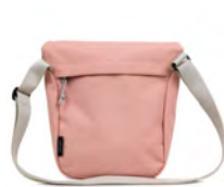
長さ調整可能なショルダーストラップ