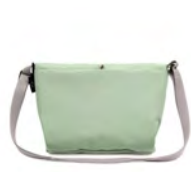
長さ調整可能な ショルダーストラップ