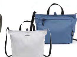
Cloudy Gray/Classic Blue クラウドグレー / クラシックブルー