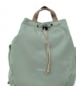
Pastel Green パステル グリーン 4895147 726816 60-0001-13 REF: 550329-379