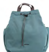
Shaded Spruce シェーデッド スプルース 4895147 723945 60-0000-26 REF: 50329-306