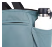
水筒や折り畳み傘の収納に便利