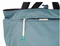
キークリップ付きのファスナーポケット