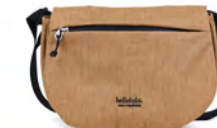
Teak Brown チーク ブラウン 4895147 726250 60-0001-66 REF : 50376-376