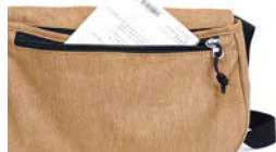
メイン収納：手前に便利な ファスナーポケット