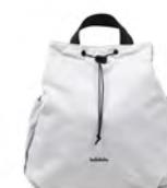
Cloudy Gray クラウドィ グレー 4895147 706368 60-0002-26 REF: 50329-419