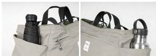
両サイドのポケットは水筒や折り畳み傘の収納に便利

肩紐と持ち手が付いたショルダーバッグにもトートバッグにもなる 2way 仕様のバッグです。撥水加工が施されているので、普段使いはもちろんアウトドアシーンなどにもおすすめです。裏返しても使えるので、その日のファッションに合わせたカラーで使えます。