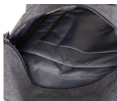
ゆとりのあるメイン収納は豊富なポケット付きで機能的