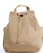
Clay Khaki クレイ カーキ 4895147 723914 60-0002-25 REF: 50329-300