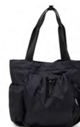
Black Onyx ブラック オニキス 4895147 730448 60-0001-32 REF : 50383-261