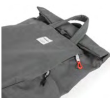
前面サイドにはキークリップ付きのファスナーポケット