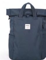
Sapphire サファイア 4895147 720685 60-0002-14 REF : 50264-176