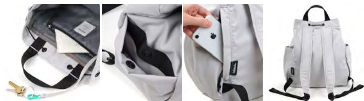
開口部は簡単に開閉できます ポケット・キークリップ付き