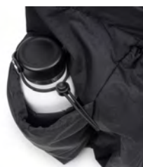
サイドポケットにはボトルを入れておけます