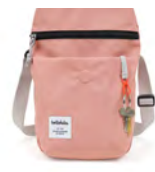
背面側：ベルクロのスリッポケット