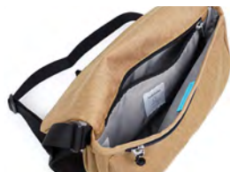
メイン収納： 仕分けしやすい収納ポケット

リサイクルしたポリエステル素材を使用しており、軽量で使いやすいだけでなく環境にも優しいアイテムになっています。撥水加工が施されているので雨の日にも安心。メイン収納には隠しマグネットボタンが付いていて、荷物の出し入れがスムーズにできます。よく取り出す小物は前面のファスナーポケットに。普段使いにおすすめのショルダーバッグです。