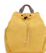
Daisy Yellow デイジーイエロー 4895147 726823 60-0001-14 REF: 50329-380