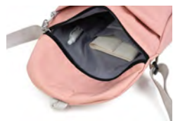
サブ収納：スリッポケットとペン差し