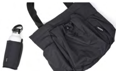
正面と両サイドに合わせて3つのポケットがついています 取外し可能なボトルホルダーでいつでも飲物を持ち歩けます