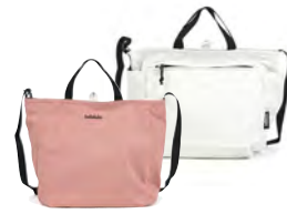
Cloud Pink/Linen クラウドピンク / リネン