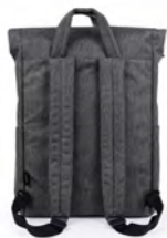
しっかりとしたハンドル付きなので持ちちも楽です