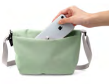
背面：面ファスナー式 スリップポケット