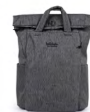
Flag Stone フラッグストーン