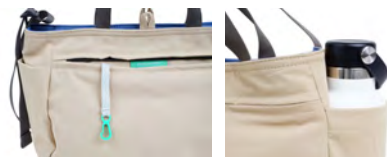
キークリップ付きのファスナーポケット