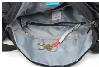
メイン収納にはファスナーポケット、スリップポケット、キークリップが付いています