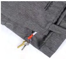
前面サイドにはキークリップ付きのファスナーポケット