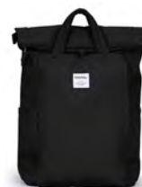
Black ブラック 4895147 712093 60-0002-17 REF : 50150-01