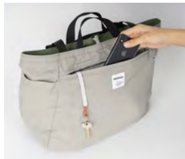
キークリップ付きファスナーポケット