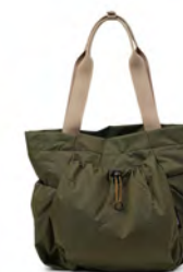
Chive チャイブ 4895147 730493 60-0001-33 REF : 50383-344

環境に優しいリサイクル素材から作られた、ボトルホルダー付きのショルダーバッグです。容量約 10L と、通勤や通学、ビジネスシーンでも使いやすいサイズになっています。軽量で使いやすいナイロン素材に撥水加工が施されているので、雨天時でも安心です。