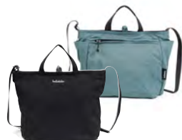
Ultra Black/Shaded Spruce ウルトラブラック / シェード スプルース