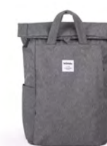
Pebble Gray ペブル グレー 4895147 720692 60-0002-15 REF : 50264-177