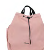
Cloud Pink クラウド ピンク 4895147 726830 60-0001-15 REF: 50329-381