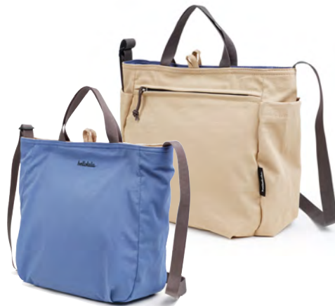
サイドポケットは水筒や折り畳み傘の収納に便利