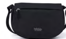
Black ブラック 4895147 730417 60-0001-64 REF : 50376-391