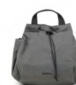
Glacier Gray グレーシャーグレー 4895147 730127 60-0000-27 REF: 50329-398