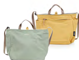
Pastel Green/Daisy Yellow パステルグリーン / デイジーイエロー