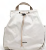
Linen リネン 4895147 723938 60-0002-20 REF: 50329-303